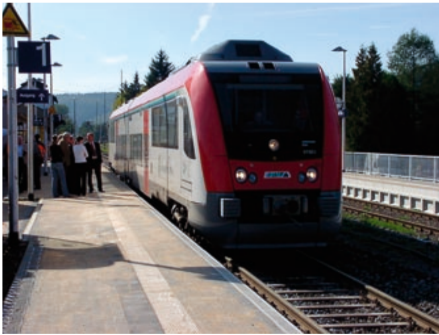
Premierenhalt: Erstmals hält ein „Itino“ am neuen Bahnsteig 1 in Bad König

Ende Oktober kommen Fahrgäste in den Genuss einer modernen Bahnstation