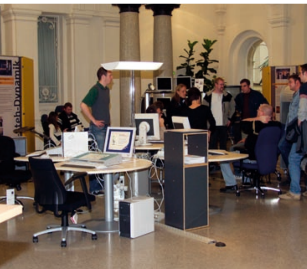
Der Besuch von Informationsveranstaltungen bietet wichtige Hilfen für Existenzgründer

Informationen für Existenzgründer zum neuen Zuschuss der Arbeitsagentur - Termin am am 9. November 2006