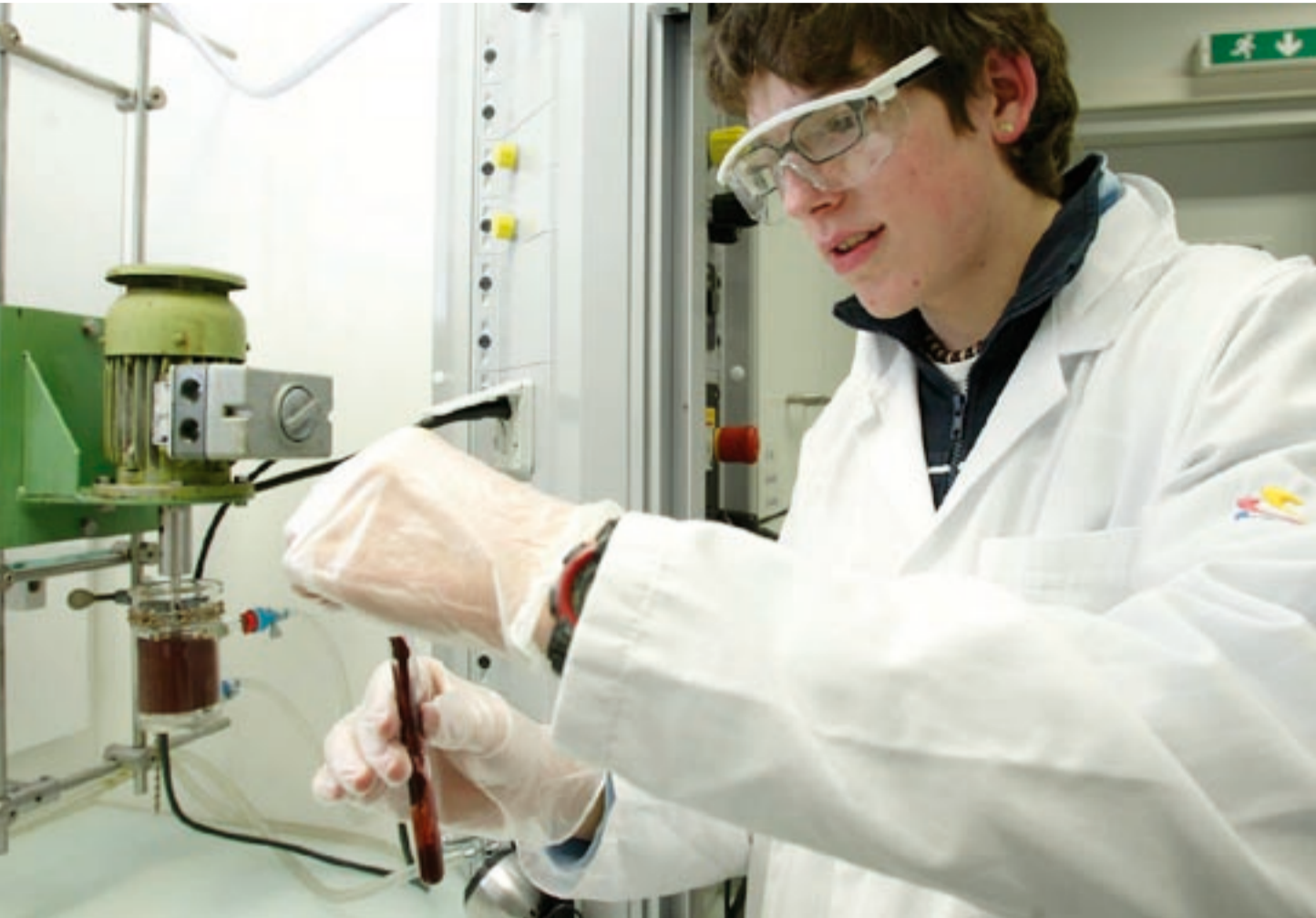
Forschen für den Wettbewerb: Schülerinnen und Schüler sind aufgefordert, beim Wettbewerb „Geistesblitze - junge Odenwälder forschen“ mitzumachen.

Idee der ODENWALDSTIFTUNG, die sich zum Ziel gesetzt hat, mit Ihrer Beteiligung an diesem Wettbewerbsmodell vor allem junge Menschen nachhaltig zu unterstützen und zu fördern