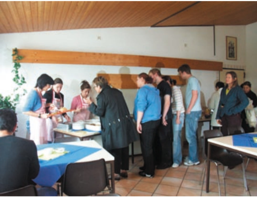
Lange Reihen und interessierte Mitarbeiter bei der Eröffnung der Cafeteria.

Neue Cafeteria eröffnet in den Räumen der BAW und überzeugt durch frische Vielfalt