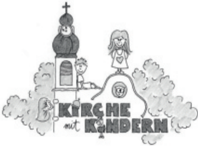
St. Gereon Nackenheim