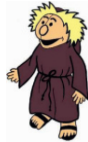
St. Alban Bodenheim